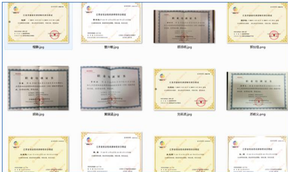
图7 学校多位教师获得创业培训师证书

学生取得创业培训合格证书。创新创业大赛成绩显著，2022年2支团队、6名同学分别荣获“中国银行杯”江苏省职业院校创新创业大赛二、三等奖。