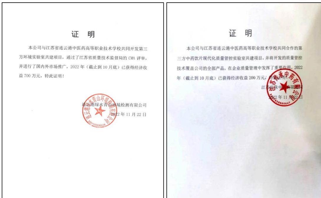
图 15 学校为企业提供技术服务产生收益证明