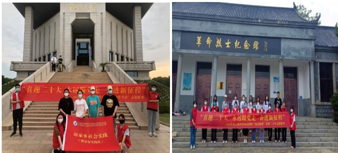
图2 学校开展校外思政实践教学