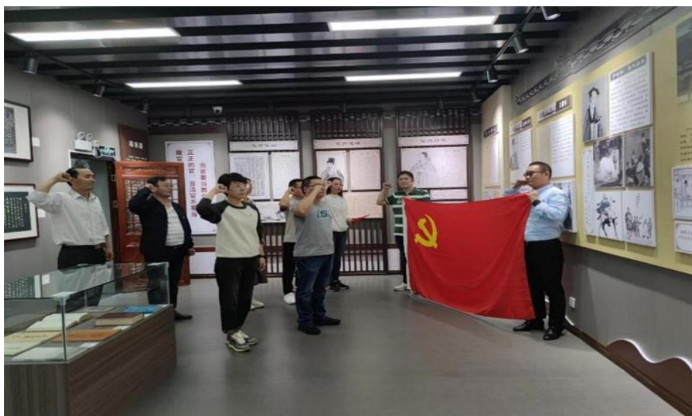
图 23 学校开展廉政文化教育

师生创作的“初心如践”受践仪式微视频在学习强国上宣传推介，创作的“丹心向党”袋泡茶受到社会各界好评，学校治理工作有序规范开展。