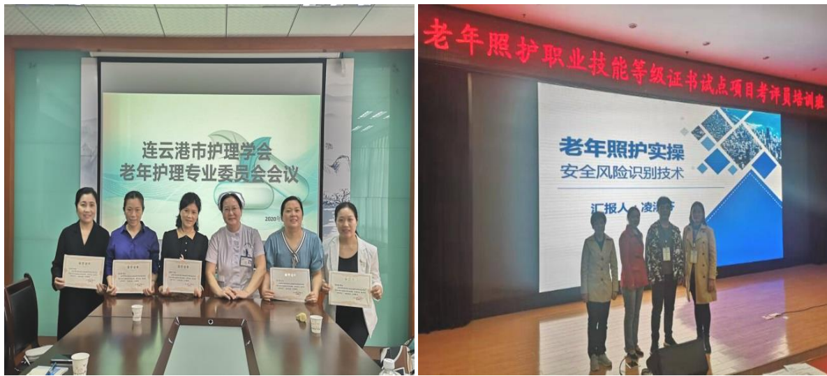
图 18 学校组织教师参加老年照护培训