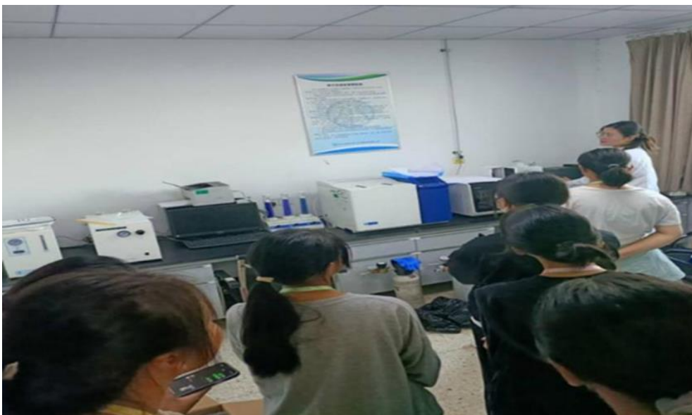
图 17 学校学生在校企合作企业绿水青山环境检测公司学习检测分析