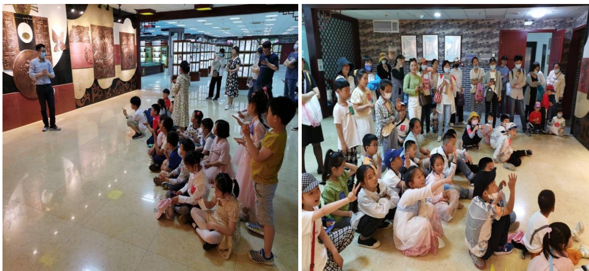
图 19 学校接待小学生们参观学习中医药传统文化

海州传统医药非遗体验中心针对中小學生不同的认知特点开发出相应的体验课程，并针对中小學生设定不同的体验标准和要求，最终让他们在自己的认知层面切身体验到传统医药非遗项目岗位的工作内容与特点。如小学生以观察和模仿，创设游戏环节、抢答加分等构建其职业感知；中学生以角色代入操作，结合职业生涯规划增强职业印象，对职业生涯有更明确认知。