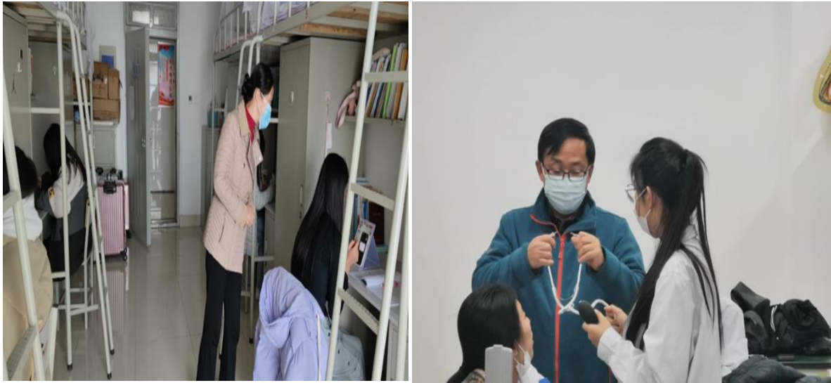
图 25 疫情期间校领导了解学生居宿舍学习和技能训练情况