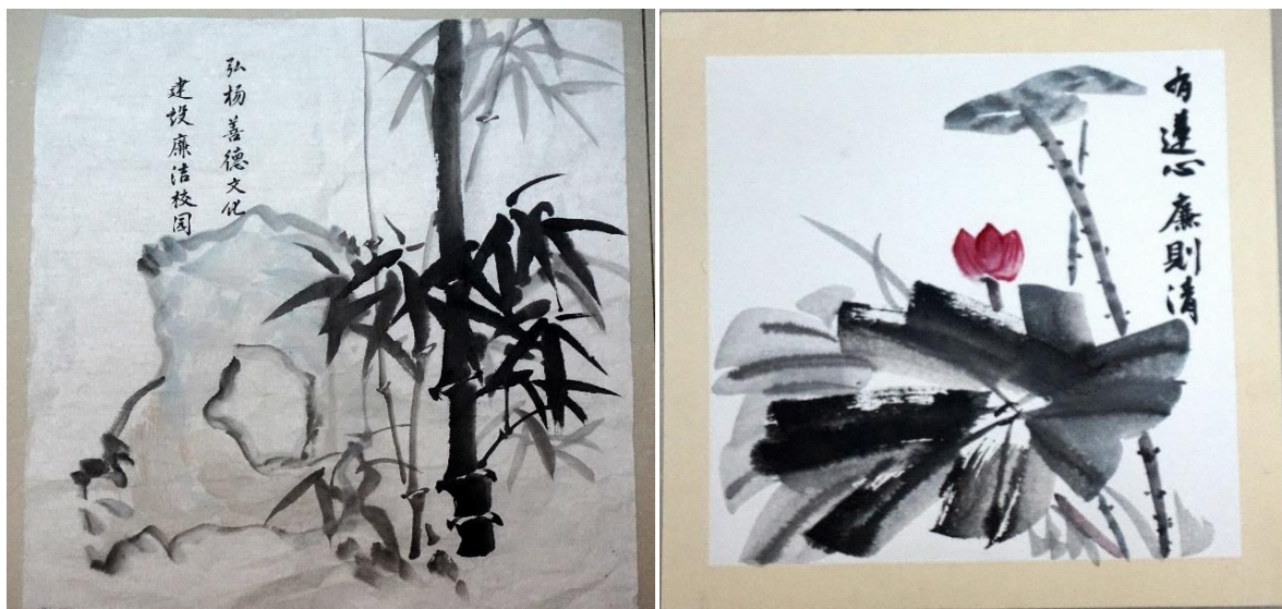
图 24 学校廉政文化教育系列作品