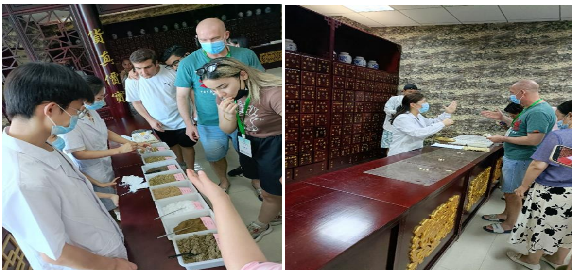
图 13 “go Jiangsu”活动中中医药文化产品展示受到国外友人关注

中医药文化产品这张明信片将中医药文化直接呈现于外国友人眼前，使之搭乘“一带一路”的快车传播渗透到世界各地。