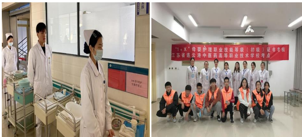
图9 学校母婴护理项目培训现场

82.6%、94.9%、98.3%；母婴护理职业技能等级证书培训考核 1 批 79 人，通过率为 100%。