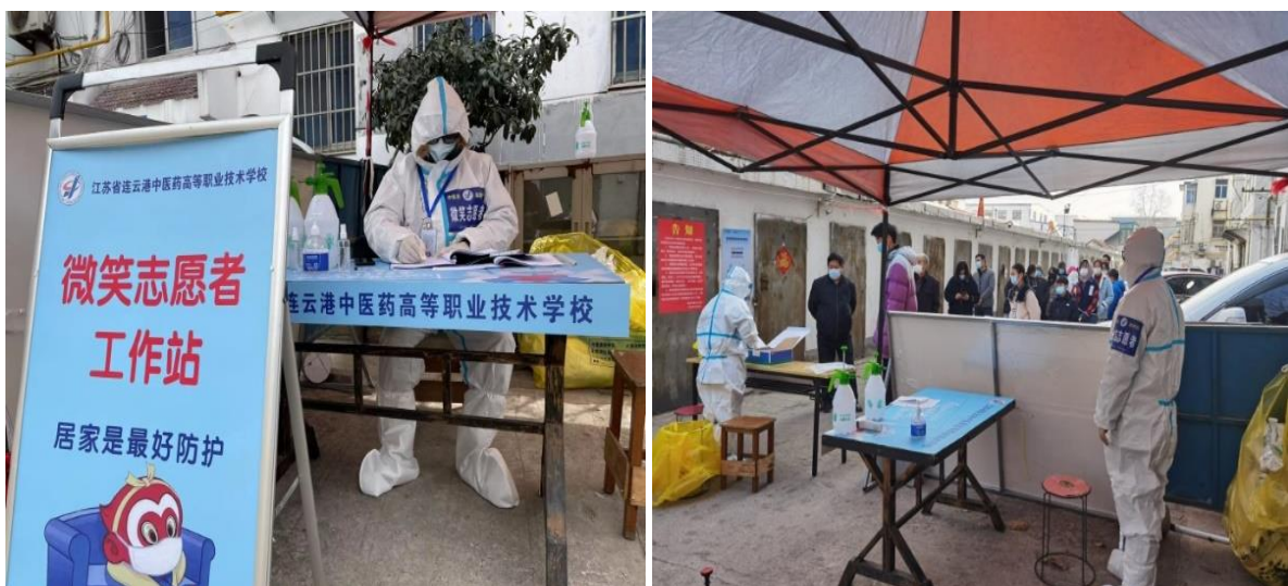
图 21 学校微笑志愿者服务队到新东方街道巨龙社区老卫校宿舍区开展疫情防控

【案例 15 组建志愿服务队，吹响抗疫“集结号”】 自新冠肺炎疫情突发以来，学校响应市委市政府号召，面向全体教职工发出倡议号召，吹响抗疫“集结号”，组建（卫校）微笑志愿者服务队，学校 13 名教职工志愿者下沉到新东方街道巨龙社区老卫校宿舍区，直奔“疫”线奋战。志愿者们实行分组轮班制，一天两组，每组 2 人，从早 7 点到晚 6 点，协助社区开展人员进出管控、信息登记、测温查码、防疫宣传、秩序维护、环境消杀、帮居民购药等工作，引导群众快速、高效、有序进行核酸检测。为了进一步配合做好核酸检测信息采集工作，加强居民个人防护意识，志愿者们主动向社区请教，学习信息采集、穿脱防护服等相关知识和技能。他们不惧危险，克服重重困难、密切配合，利用“线下（流动大喇叭）+线上（小区微信群）”积极做好疫情防控宣传引导工作，切实保障社区疫情防控工作安全有序进行。