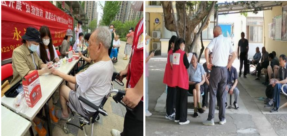
图1 学校开展“远志健康行”志愿服务活动

【案例2 多彩小社团撑起缤纷大思政】 学校坚持“多彩小社团撑起缤纷大思政”的工作思路，把思政实践课堂与社团活动相结合，积极探索社团活动与思政元素紧密融合。