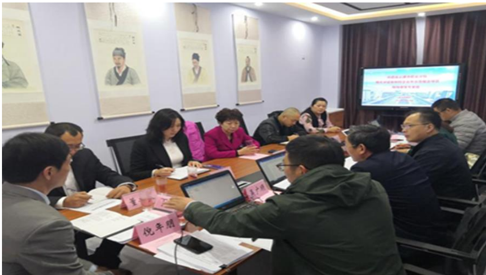
图 16 学校与合作医院开展共建项目研讨

学校本年度校企合作项目取得典型成效，被认定为连云港市校企合作示范组合项目 2 项，连云港市现代学徒制项目 2 项，连云港市特色产业学院项目 3 项。