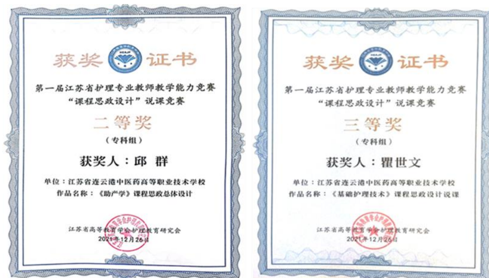
图 10 学校邱群和瞿世文老师的课程思政设计在江苏省说课竞赛中获奖

学校继 2021 年《基础护理技术》课程获教育部“课程思政示范课程”后，本年度又有 2 门课程分获第一届江苏省护理专业教师教学能力竞赛“课程思政设计”说课竞赛二、三等奖；课程思政研究课题获第五期“江苏省职业教育教学改革课题”立项。