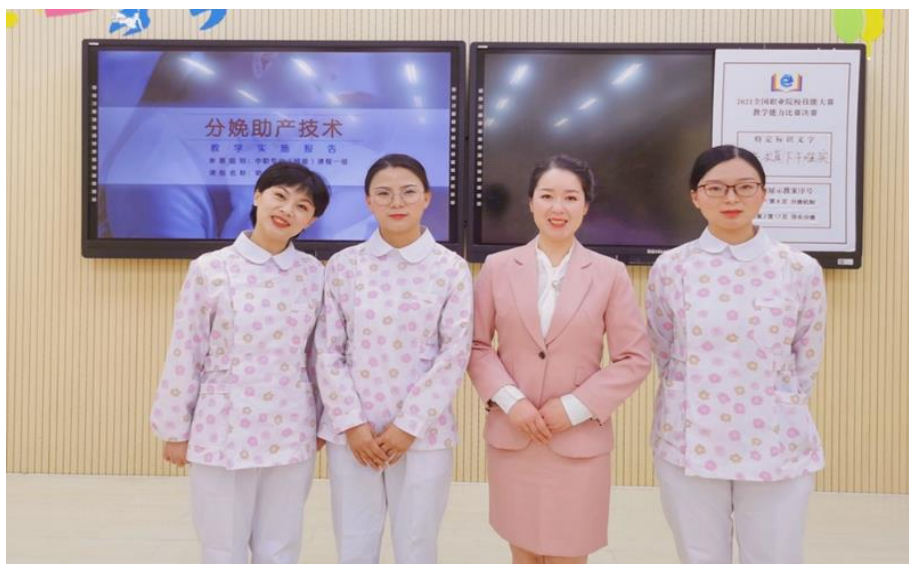
图 11 《分娩助产技术》获 2021 年全国职业院校教学大赛二等奖

学校教学改革成绩显著，本年度教师参加各级各类教学大赛，共获得全国二等奖一项，省二等奖三项、三等奖三项、市一等奖二项、二等奖三项、三等奖四项。