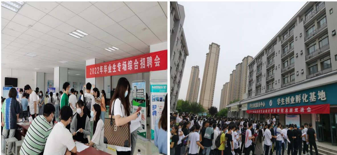
图5 学校召开毕业生综合招聘会

学校充分发挥“线上线下双融合”的促进作用，为学校毕业生和用人单位搭建良好的交流平台，“就业促进月”合计为毕业生提供了1000余个就业岗位，为毕业生们的顺利就业增强了信心、创造了更多的机会。