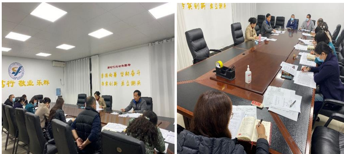
图 22 学校组织召开项目建设专题推进会

通过流程化的项目管理方式，明确了工作流程，提高了工作效率，保障了项目进度。据统计，学校重点项目建设程度已经超出 50%，项目推进时效比以往提升了约 30%。