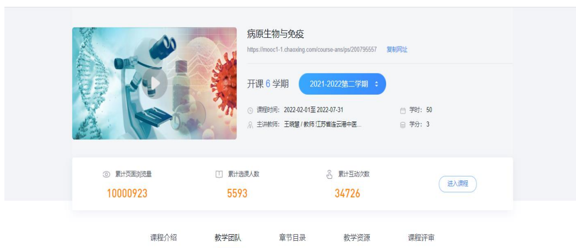
图 12 《病原生物与免疫》课程线上教学资源得到广泛应用

真软件开发的企业，协同临床工作经验丰富的产业导师，共同进行课程资源开发与建设。教学资源含电子教案、课件、图片、3D动画、习题与测试、实验指导、教学视频、实验报告、案例教学资源。其中，仿真视频、Flash动画、微课视频类资源共127个，占比45%，视频总时长达1538分钟。课程依托超星泛雅学习平台和学习通（手机端）进行线上线下混合式教学，教师依据学生线上教学资源使用情况反馈，了解学生学习情况。该平台目前累计页面浏览量达近783万人次，累计互动次数达16754次，选课人数达5586人次。同时课程在线平台对外开放，满足社会人群对于本课程在线学习需求。